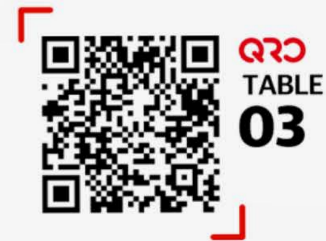
QR 찍고 체험하기