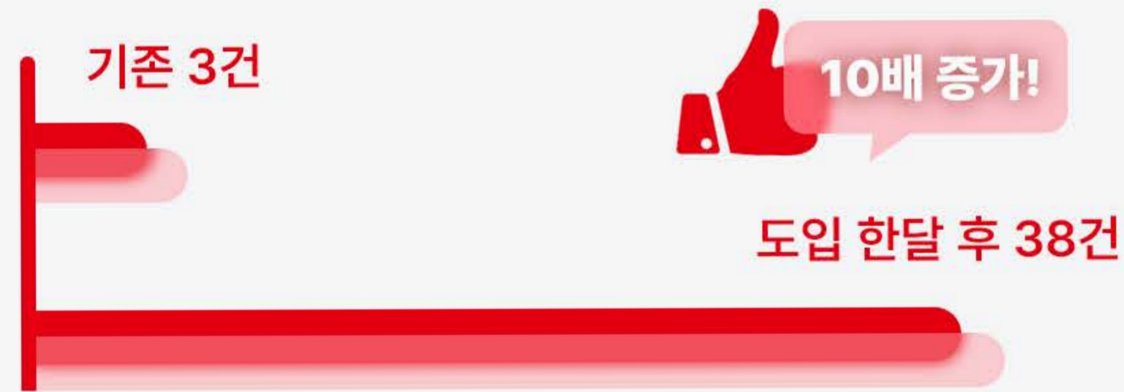
큐로 도입 후 네이버 리뷰 작성 10배 증가