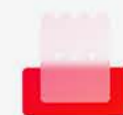
POS & KIOSK