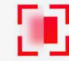
테이블오더 웨이팅 TABLET & QR